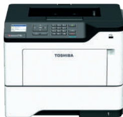
550 Blatt Zusatzkassette**