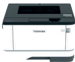
550 Blatt Zusatzkassette*